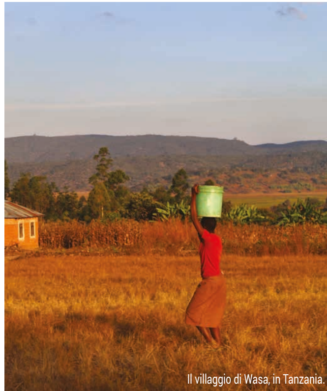
Il villaggio di Wasa, in Tanzania.

Tuttavia, l'iniziativa ha avuto ricadute anche sul territorio brianzolo.